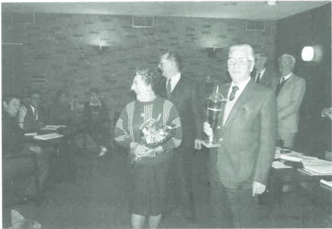
Uitreiking van de wisselbeker aan één van onze oudste en meest actieve leden.