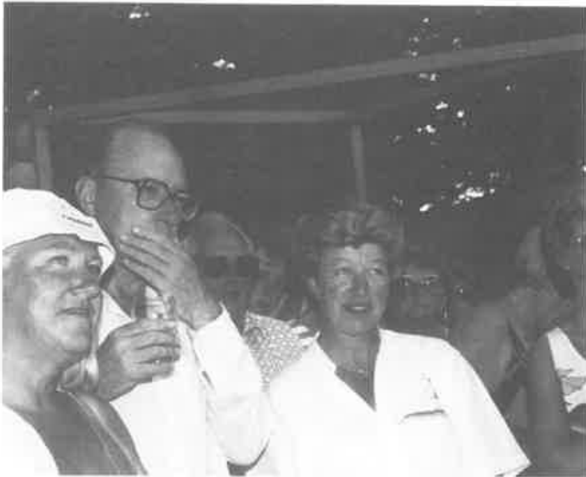
De Lustrumcommissie 1988