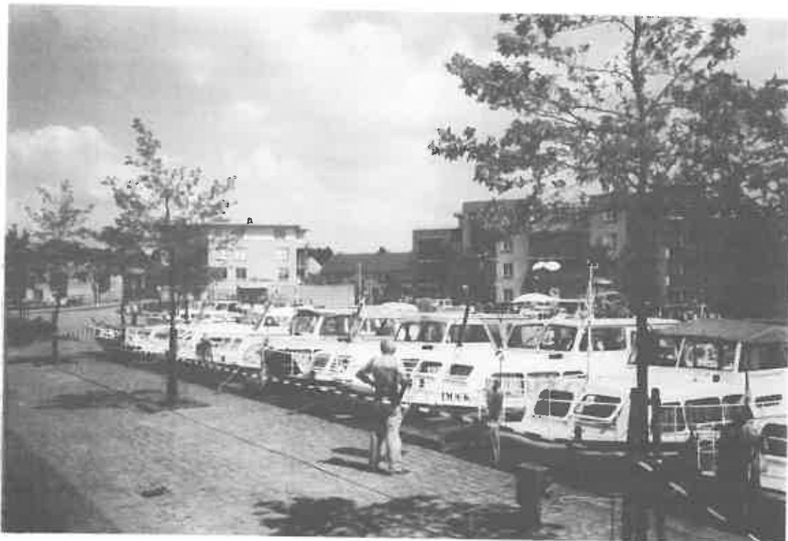
Ligplaats 30 merentocht in Sneek

Ad 8. Leden die vragen hebben worden verzocht deze vòòr de vergadering schriftelijk in te dienen bij het bestuur.