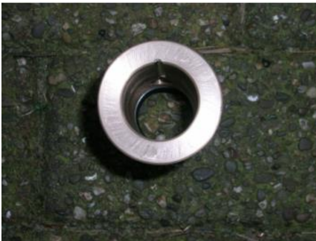
foto 7 De gehele constructie over de schroefas geschoven