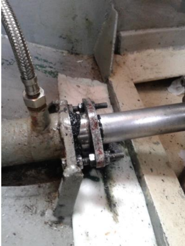
foto 2 Binnenste gland verwijderen

foto 1 de oude en welbekende constructie, vet all over the place