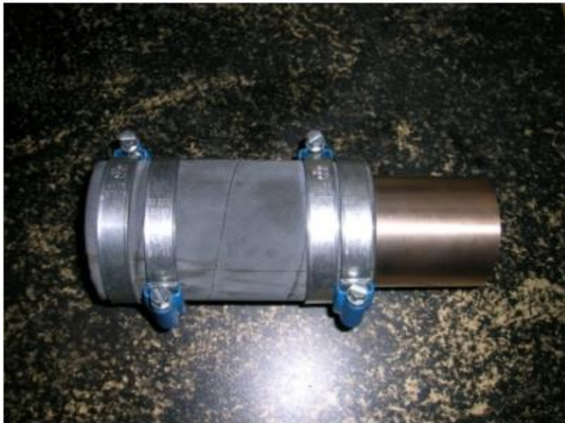
foto 4 aansluitmof gescheiden van een bronzen bus met keerringen