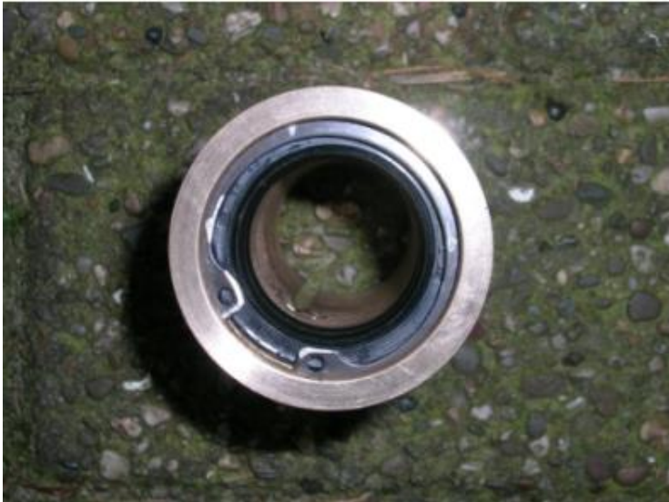
foto 6 Op onderstaande foto is de groef zichtbaar voor verspreiding van het vet